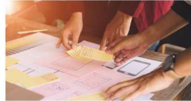
Seguiment, control i planificació dels contractes públics