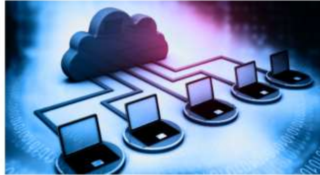
Aplicacions ofimàtiques corporatives al núvol