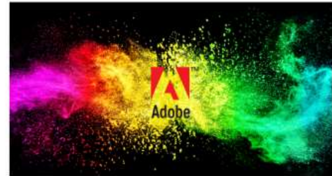
Programari d'edició i disseny gràfic