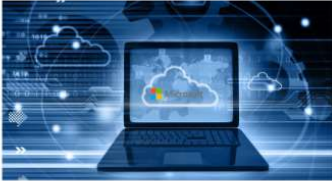
Llicències de programari Microsoft i VMWare

https://www.localret.cat/serveis/central-de-compres/acords-marc/