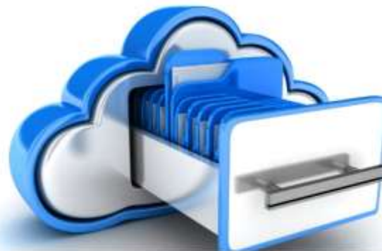
Programari de còpies de seguretat (Backup)